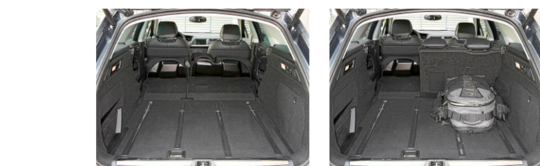
Der Gepäckraum ist eben... und nach Bedarf variierbar.

Der Baureihe C5 dar. Die Drehmoment- (maximal 249 Nm) und Leistungsdaten (maximal 155 kW, 215 PS) entlarven ihn als etwas in die Jahre gekommen. Dies bestätigt sich auch im Fahrbetrieb: Das Auto lässt sich zwar ausreichend zügig beschleunigen, ist aber mit dem hohen Gewicht schnell einmal an seiner Leistungsgrenze angelangt. Daran können auch die zwei Schaltprogramme des 6-Gang-Automatikgetriebes nichts ändern. Bezüglich Benzinverbrauch hat der C5 Tourer Mühe, mit den Besten mithalten zu können. Die Baureihe C5 dar. Die Drehmoment- (maximal 249 Nm) und Leistungsdaten (maximal 155 kW, 215 PS) entlarven ihn als etwas in die Jahre gekommen. Dies bestätigt sich auch im Fahrbetrieb: Das Auto lässt sich zwar ausreichend zügig beschleunigen, ist aber mit dem hohen Gewicht schnell einmal an seiner Leistungsgrenze angelangt. Daran können auch die zwei Schaltprogramme des 6-Gang-Automatikgetriebes nichts ändern. Bezüglich Benzinverbrauch hat der C5 Tourer Mühe, mit den Besten mithalten zu können.