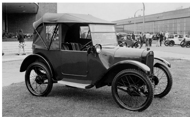
Austin Seven, 1922 (4 Zylinder, 745 cm 3 , 15 PS).

nachdem er die Pläne für die Nachkriegsmodelle genehmigt hatte. Seine Marke war nach dem Zweiten Weltkrieg Englands Nr. 1. Wie einst der Seven, so wurde der von Alec Issigonis entworfene Mini zu einem internationalen Begriff. Dieses Modell wurde 1959 als Austin Seven 850 und als Morris Mini-Minor 850 vorgestellt. Denn 1952 waren die Austin Motor Co. und die Nuffield-Gruppe (Morris, MG, Wolseley, Riley) zur British Motor Corporation (BMC) zusammengeschlossen worden. Daraus ging schrittweise ein mächtiges Konglomerat hervor, dem ein Grossteil der bekannten britischen Automarken angehörte. Unter den unausweichlichen Sanierungsmassnahmen wurden ab 1987 auch die Austin-Modelle unter die Marke Rover gestellt. RG