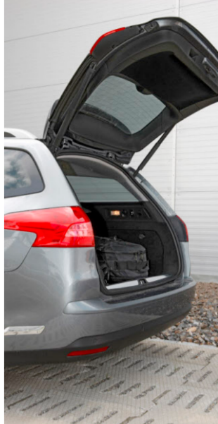
Die grosse Heckklappe lässt sich elektrisch betätigen.

Die Sensor- und Schutzpakete (Fr. 1600.-, Fr. 750.-) beinhalten sicherheitsrelevante Features; die Business-, Integral- und Konzertpakete (Fr. 5900.-, Fr. 8150.-, Fr. 3800.-) vor allem Komfortsysteme. Insgesamt stellt der Tourer 3.0iV6 Exclusive zum Preis von Fr. 52090.- ein faires Angebot dar.