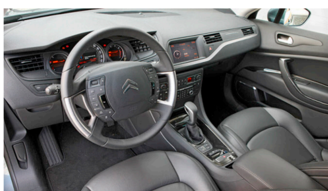
Grosse Lenkradnabe: feststehend und reich bestückt mit Schaltern.

Die elektrische Parkbremse – und deren etwas langsame Reaktionen auf die Betätigung am kleinen Hebel in der Mittelkonsole – sind Gewöhnungssache.