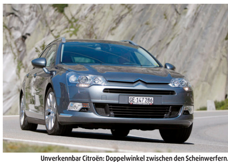
Unverkennbar Citroën: Doppelwinkel zwischen den Scheinwerfern.