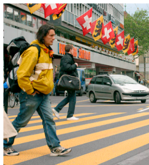
Sicher? Kritik am Zebrastreifen