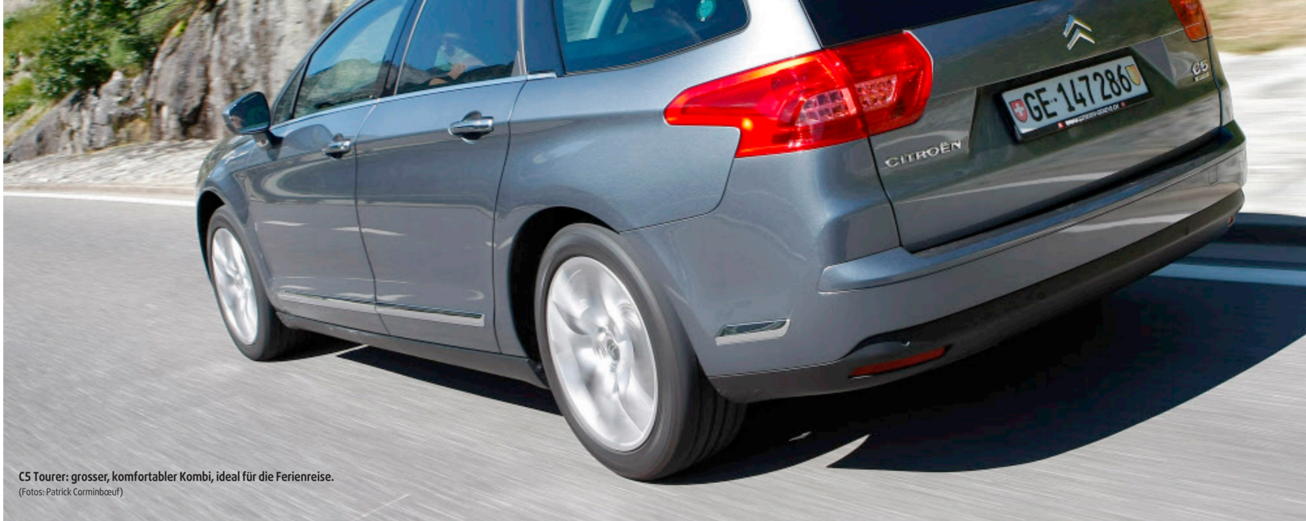
C5 Tourer: grosser, komfortabler Kombi, ideal für die Ferienreise.

Der Gepäckraum ist eben... und nach Bedarf variierbar. Integrierte Taschenlampe. C5-Fond: viel Platz für zwei. Manuelle Niveauekontrolle.